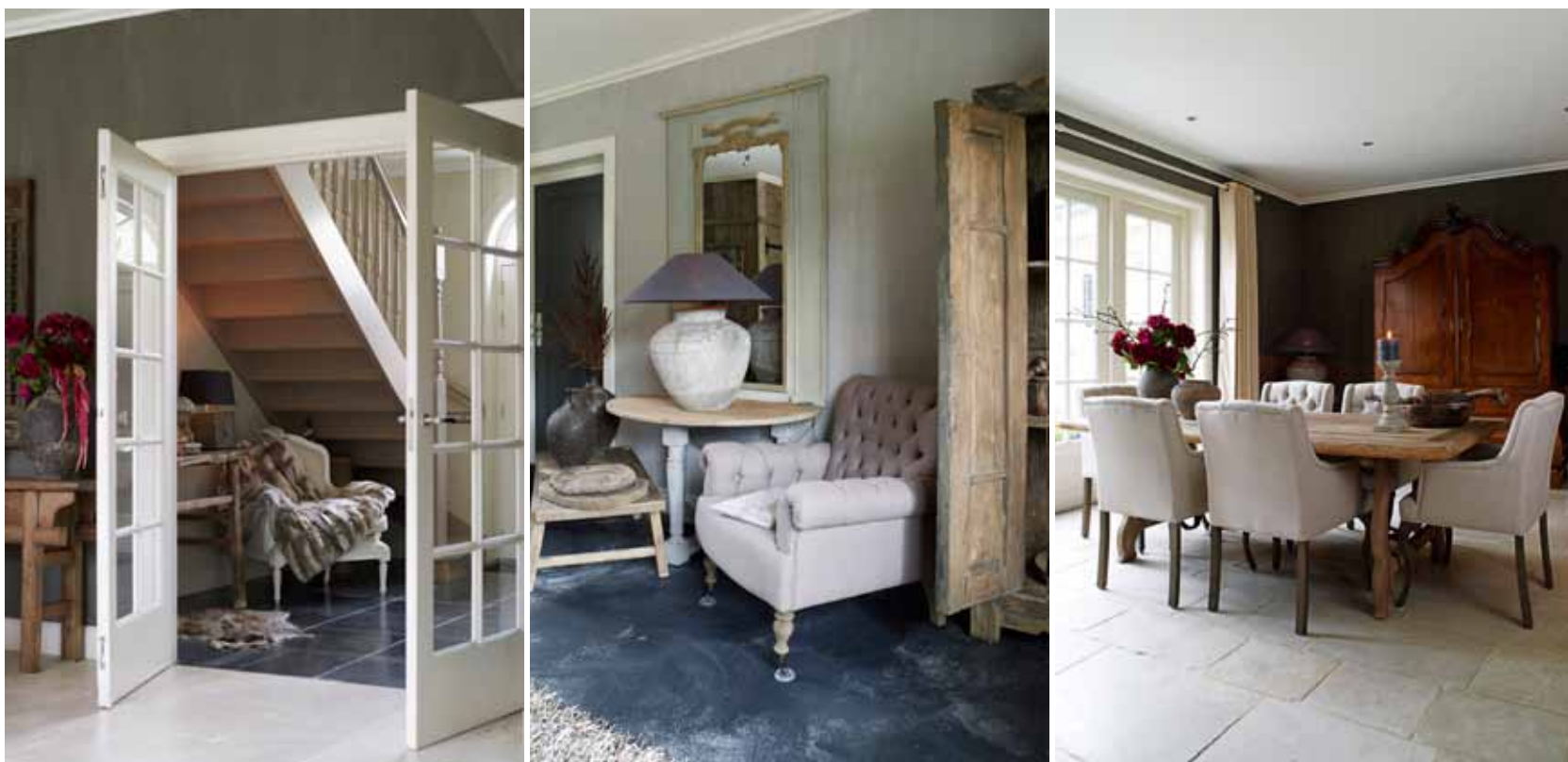
Foto midden: wat begon als garage is sinds kort de werkkamer van Betty. Hier ontvangt ze haar klanten. De sfeer is warm en huiselijk dankzij ruwe, natuurlijke materialen en een kleurpalet van grijs, bruin en grijsblauw. Op de vloer is met zwarte en grijze verf een gevlekt patroon aangebracht.

We hebben het over eind jaren negentig. Ze noemde haar prille zaak De Appelgaard. Later verhuisde het gezin naar een ander pand en begon